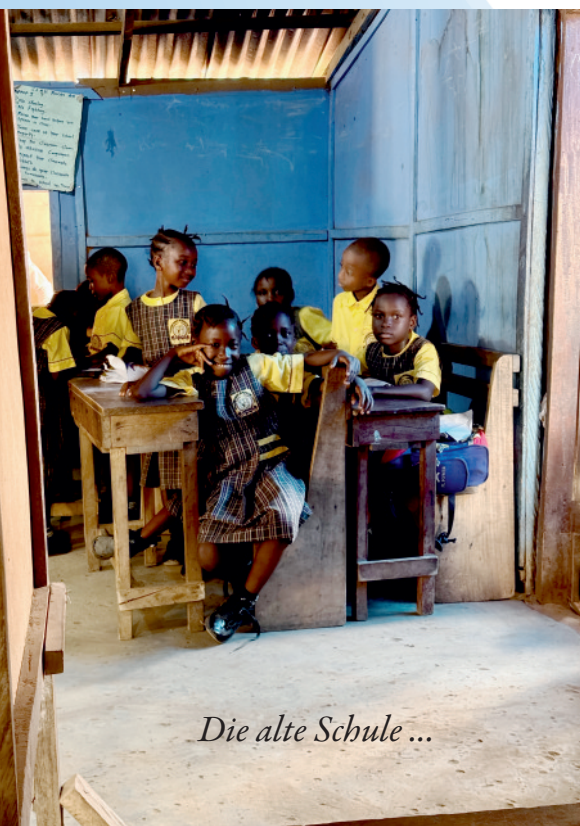
Die alte Schule ...

Ein Baustein unseres Projekts ist die Herstellung wiederverwendbarer Damenbinden. Zwanzig Frauen aus Mongegba sollen geschult werden, einfache, hygienische Binden zu nähen und sie